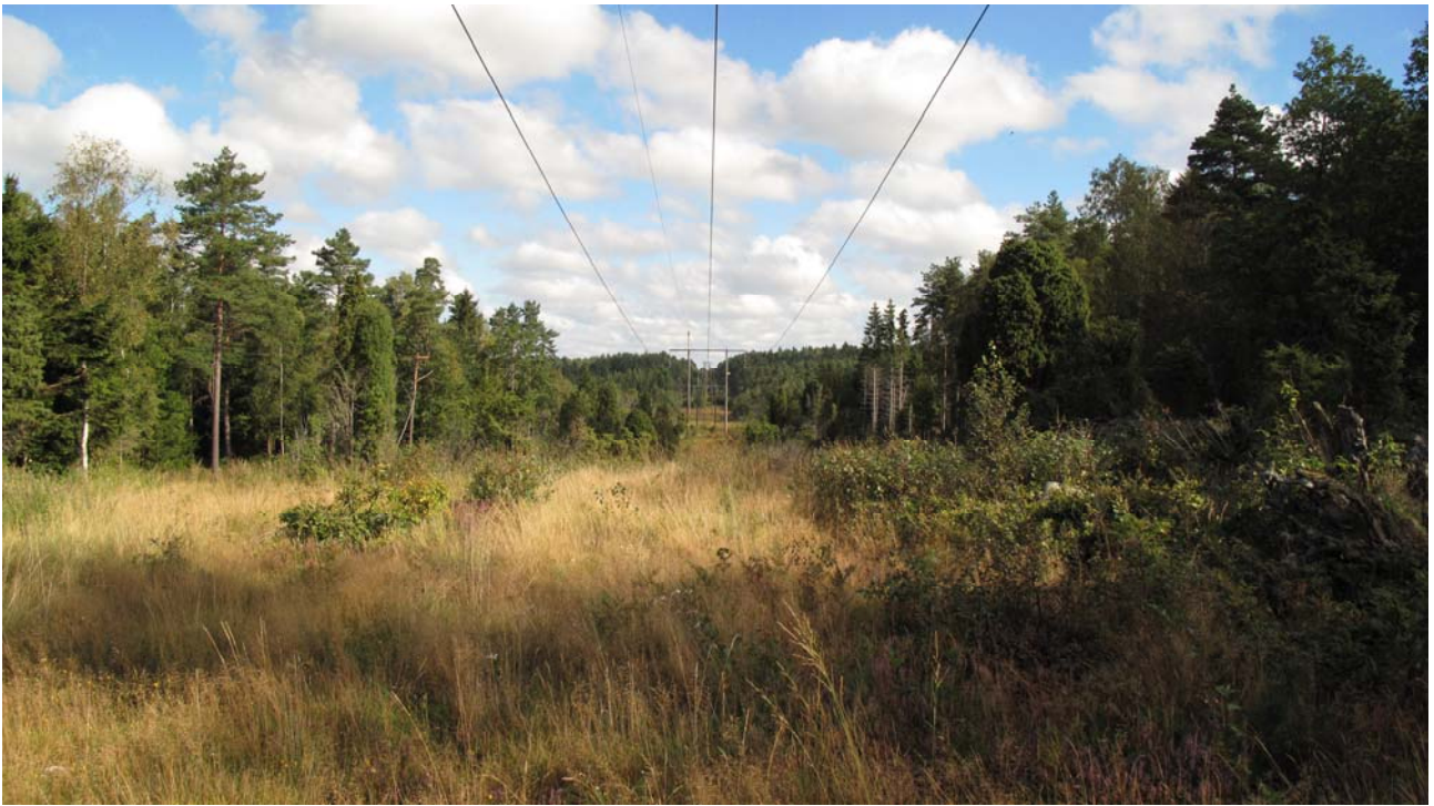
Utsikt mot norr och område C, från ändhållplatsen för buss 408, Sandsjödal.

Planskrivarna skall inte bara ha ris. Tre vackra röda rosor vill vi dela ut för arbetsgruppens svar till Miljöpartiet de gröna i Ale för deras påstående: